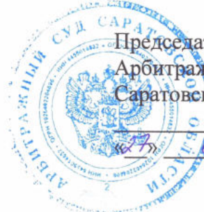
График прохождения стажировки обучающимися ФГБОУ ВО «СГЮА» в 2024/2025 учебном году в Арбитражном суде Саратовской области