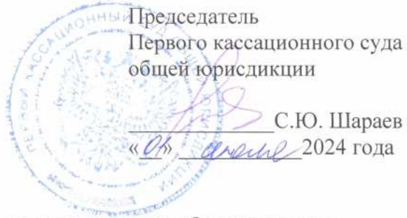
График прохождения стажировки обучающимися ФГБОУ ВО «СГЮА» в 2024/2025 учебном году в Первом кассационном суде общей юрисдикции

Председатель Первого кассационного суда общей юрисдикции