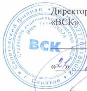
График прохождения стажировки обучающимися ФГБОУ ВО «СГЮА» в 2024/2025 учебном году в Страховом акционерном обществе «ВСК»