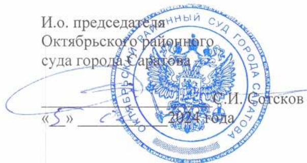
График прохождения стажировки обучающимися ФГБОУ ВО «СГЮА» в 2024/2025 учебном году в Октябрьском районном суде города Саратова

И.о. председателя Октябрьского районного суда города Саратова