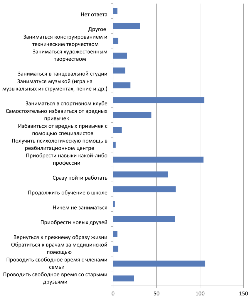
Рис. 1. Планы выпускников СУВУ.

от общего числа детей 11–13 лет). Можно предположить, что дети недостаточно социализированы; не знают, к кому можно обратиться за помощью, либо не верят, что их примут и помогут.