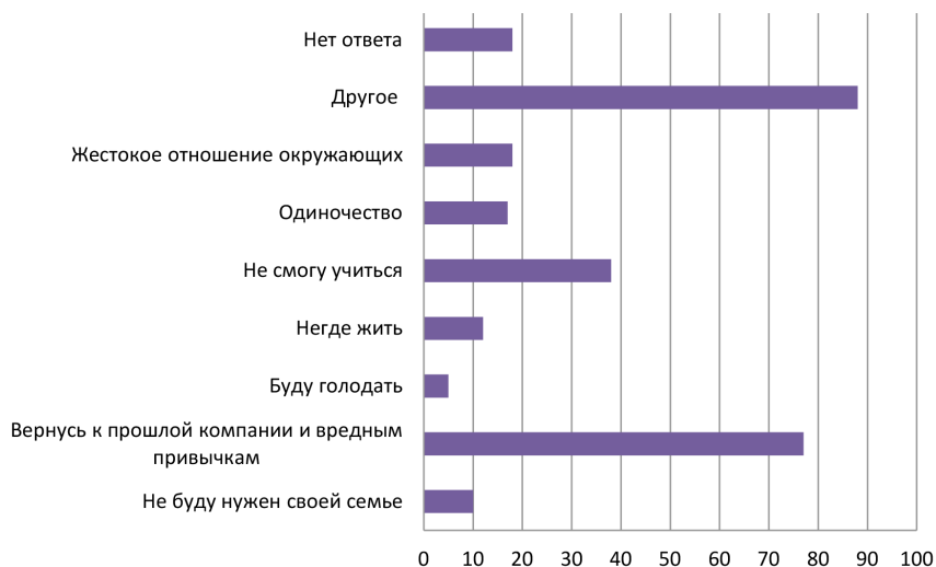
Рис. 2. Проблемы, волнующие выпускников СУВУ.

их в перспективе после выпуска из СУВУ (рисунок 2). Этот вопрос вызвал наибольший личностный отклик: 88 детей (41,3%) дали свой вариант ответа в графе «Другое», из них 50 ребят (21,6%) ответили, что их ничего не волнует, «все хорошо» и «нет проблем». 7 человек (скорее всего, из одного СУВУ) отметили как проблему, что в их аттестатах будет запись об общественно опасном поведении. Проблему с поступлением в образовательную организацию, дальнейшим обучением в школе или получением профессии выделили 12 воспитанников. Среди проблем также прозвучали «лень», «неизвестность», «потерять самоконтроль», «предстоящий суд по старому делу», «несостоятельность в делах и работе», получение жилья (сирота), помощь в трудоустройстве.