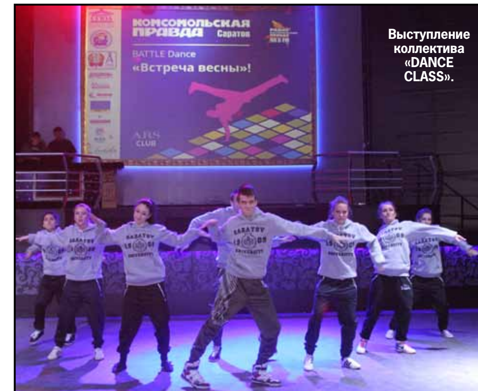
Выступление коллектива «DANCE CLASS».

полезные приятные призы: каждому члену команды были вручены купоны на обучение в автошколе «Мастерлюкс», бесплатные тренировки в клубе «Alex Fitness», абонементы на