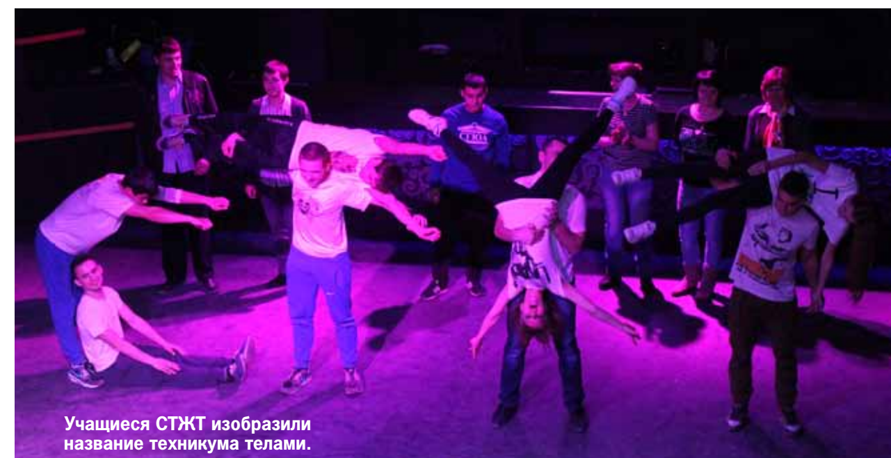
Учащиеся СГЖТ изобразили название техникума телами.