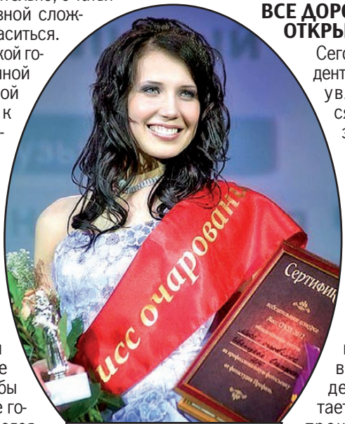
Таким видят лицо Универсиады студенты СГЮА.

Что ж, сегодня нам остается только пожелать им всем удачи, чтобы потом, после окончания этих главных для всех студентов страны соревнований, в который уже раз можно было сказать: «Виват, академия!».