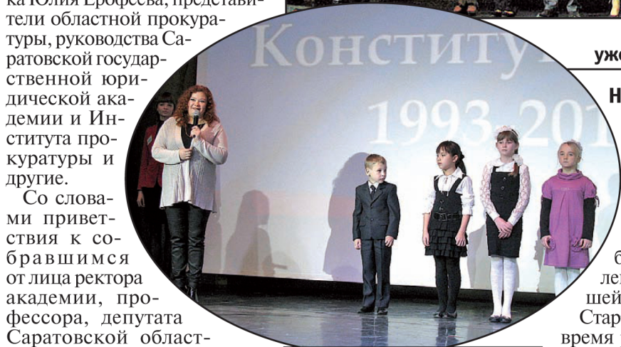
Знать законы нужно с детства! Самые маленькие участники конкурса.