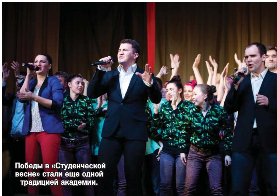
Победы в «Студенческой весне» стали еще одной традицией академии.

В этом году многие наши ученые стали обладателями грантовых проектов Российского фонда фундаментальных исследований, Российского гуманитарного научного фонда и т.д. Такие фонды, напомним, ежегодно проводят конкурсы для молодых ученых, в поддержку научных школ. И здесь нам также есть чем гордиться: академия является грантообладателем как минимум десяти проектов. Многие наши ученые занимаются работами на уровне фундаментальных исследований, причем грантовые проекты осуществляются