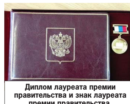
Диплом лауреата премии правительства и знак лауреата премии правительства.

Проведение столь престижной и амбициозной работы в области технологий двойного назначения стало возможным благодаря богатому оснащению предприятий